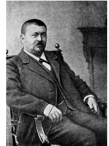
С.Т. Морозов (1862–1905 гг.)

Установите соответствие между человеком, изображённым на портрете, и его краткой характеристикой.