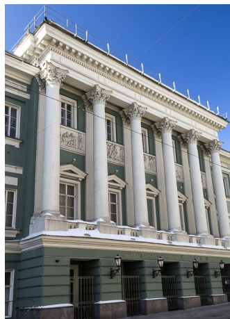
Зал Дворянского собрания на Охотном ряду