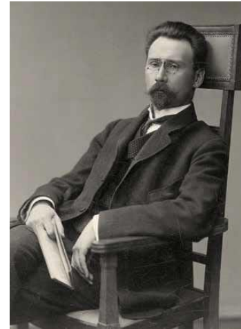
А.А. Бахрушин (1865–1929 гг.)