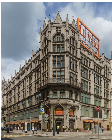
Здание ЦУМ (торговый дом Мюр и Мерилиз)