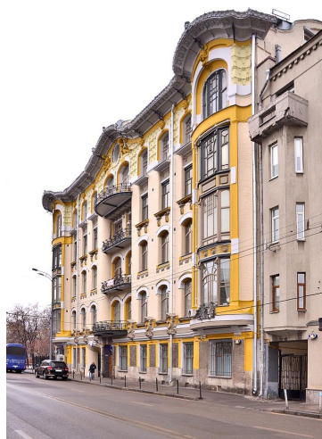
Доходный дом купца Исакова на Пречистенке

Обведённые цифры запишите в ответ без дополнительных знаков.